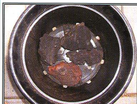
Forskellige former for dræn i bunden af potten hhv. flamingofyld - små potter - lava