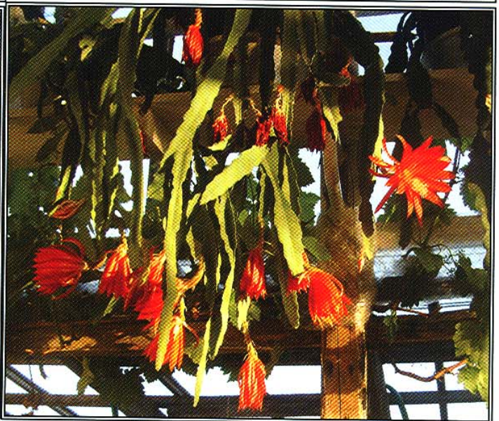
Øverst og nederst til venstre: Epiphyllum crenatum v. chichicastenango Øverst til højre: Epiphyllum crysocardium .